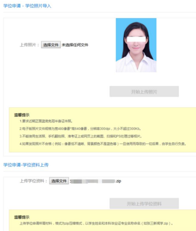
图5 上传学位照片及申请材料。

点击“选择文件”，分别上传学位照片和学位申请材料，上传后，点击“下一步”进行学位信息确认。