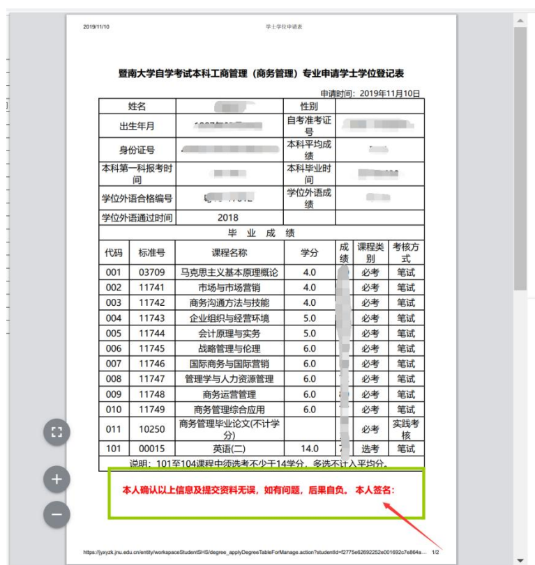
图 9 打印学士学位登记表

注意：打印好后必须在本人签名处签名（上图圈中位置），否则学士学位登记表无效，后果自负。