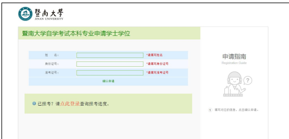
图 2 学位申请登录页面