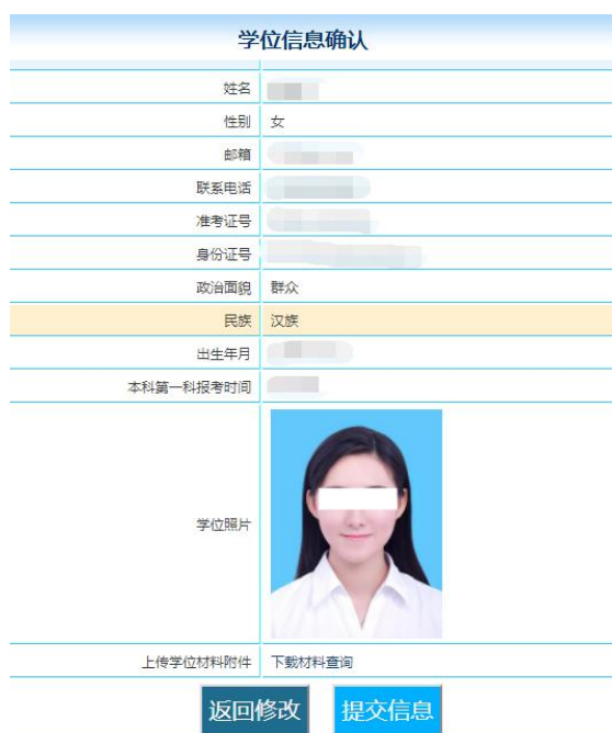
图 7 学位信息确认