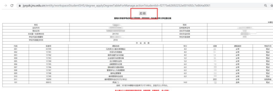
图 8 学士学位登记表打印